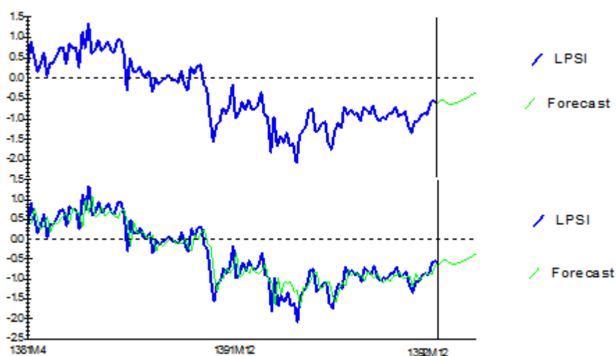
نمودار (3): پیش‌بینی متغیر قیمت سهام

نهاد اصلی بازار سرمایه در ایران بورس اوراق بهادار است. از این رو شناخت عوامل تأثیرگذار بر متغیرهای مهم در این بازار و پیش‌بینی آن امری ضروری به نظر می‌رسد. این مقاله به بررسی نحوه تأثیرگذاری متغیرهایی مانند شاخص بهای کالاها و خدمات، شاخص بهای کالاهای صادراتی، رشد قیمت دلار، قیمت سکه، قیمت نفت و دامی مربوط به سیاست‌های دولت حاکم قیمت سهام در بورس اوراق بهادار پرداخته شده و سپس ثبات و پیش‌بینی این تابع صورت گرفته است.