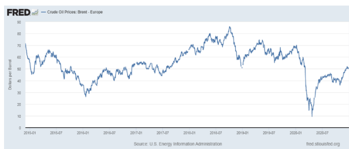
نمودار (۱): روند قیمت نفت خام برنت طی دوره زمانی (۲۰۱۴-۲۰۲۰) قیمت‌ها به دلار آمریکا در هر بشکه است.